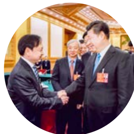
2016年3月全国两会期间，中共中央总书记习近平与永清环保集团董事长刘正军就环境治理问题亲切交流。

永清是卓越品牌的创造者。多次荣获“全国环保优秀品牌企业”、“全国环境综合服务竞争力领先企业”、“国内环保行业唯一”“中国最佳创新公司50强”企业、“最佳环境贡献上市公司”、“最具社会责任感企业”等荣誉。